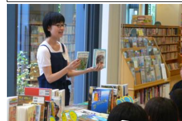
ブックトーク「こんな本もあるよ!」

その後、図書館に移動し聞いたのは、スタッフによるブックトーク(本の紹介)。学年で3チームに分かれて行いました。興味のある本、読みたい本は見つかったかな?この日の教室で借りられた本は309冊。この「みんと」が出る頃にはきっとすてきな感想文が書きあがっていることでしょう!