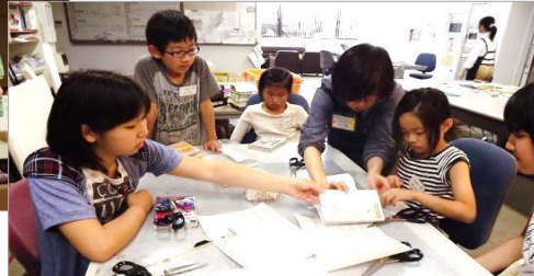
←新しい本にフィルムコートを貼る作業。きれいに貼るのは大変! みんな、顔が真剣です。