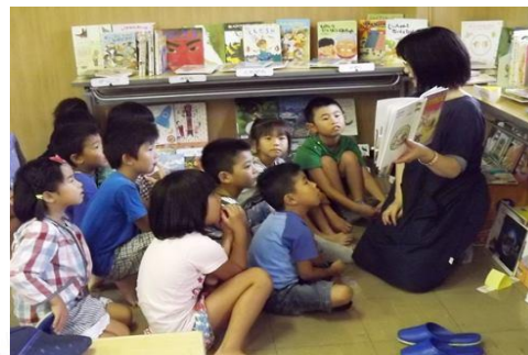
↑ 昨年の様子 (古枝公民館)

「こんな本があったんだ~」「読んでみようかな・・・」 と考えるような本をいろいろ用意していますので、手にとってみてくださいね。借りることもできます。