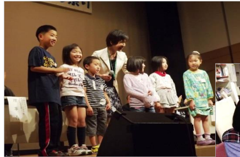
←舞台でドキドキ・・・!! 大きな声であいさつしました♪

小学生12人が参加しました。エイブル祭りの開会式に舞台であいさつしたり、カウンターでの貸出や返却作業にもチャレンジ！すこし緊張している様子でしたが、利用者の方の笑顔に見守られ一生けんめい作業してくれました。最後は館長から修了証を渡して終了！「またやってみたい」との嬉しい感想も聞かれました。