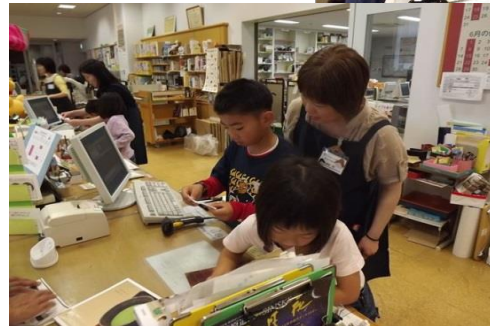
↑貸し出しもちゃんとできました☆