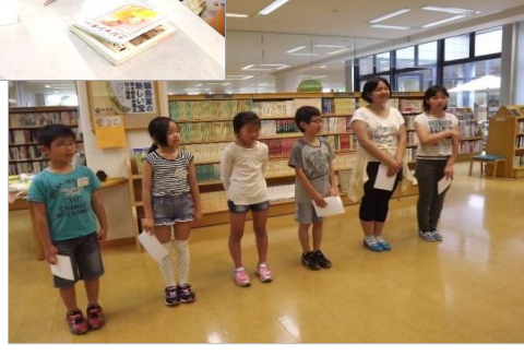
↑一日お疲れさまでした!また図書館に来てね～