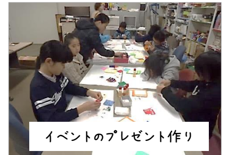
イベントのプレゼント作り