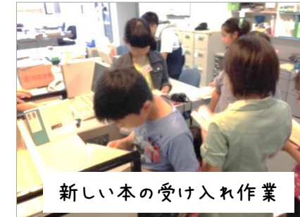
新しい本の受け入れ作業