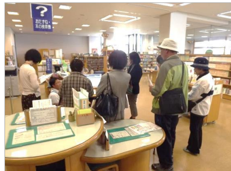
★昨年はじめて開催したこの講座。参加者の方にも好評でした★

時間：10時～12時 対象：高校生以上 場所：エイブル3階 研修室A 申し込み：カウンターまたは電話にて受付 定員：15名(先着順) 内容：パソコンやiPad(アイパッド)を使って、図書館の本を探したり、インターネットでの予約のやり方を体験します。職員が分かりやすくレクチャーしますので、ぜひ、ご参加ください！