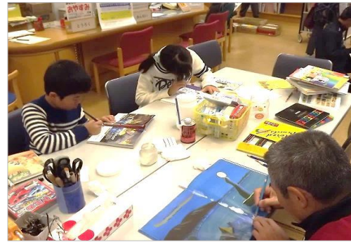
★子どもかも大人も楽しく修理を体験できます！傷みを補修することで読みやすく永く保存できるようになります★

時間：●10時～11時30分 ●13時30分～16時 場所：館内 事前申し込み：不要 対象：小学生～大人 内容：ページが外れたり破れたところを直す15分程度のワークショップです。修理をしたい本をお持ちください。図書館の本で修理を体験することもできます。