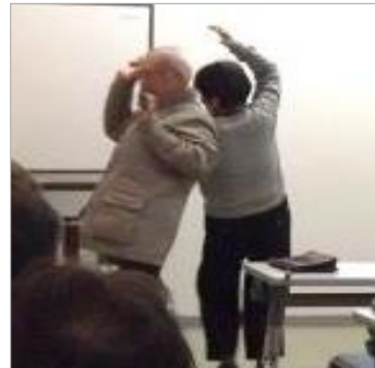
最高齢(87才)の参加者の方とわらべうた遊び「なべなべこめけ」を楽しんで。