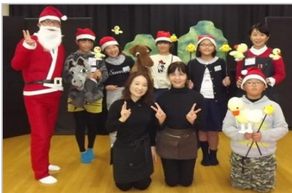
クリスマス会のお手伝い