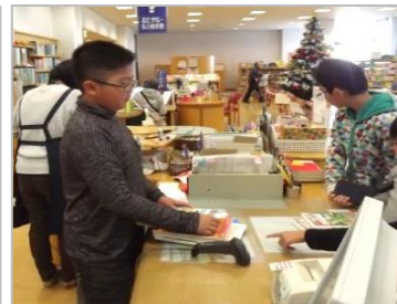
貸出・返却カウンター