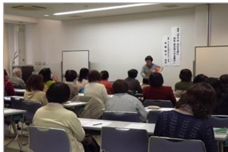
38名の参加がありました！ 男性の方も3名参加されました。