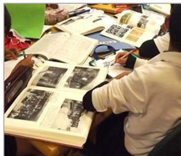
地域コーナーの本をいろいろ探して、熱心に調べていました！