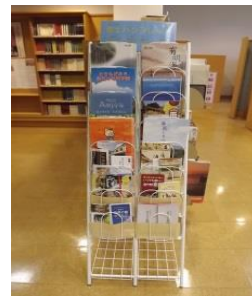
パンフレットスタンド