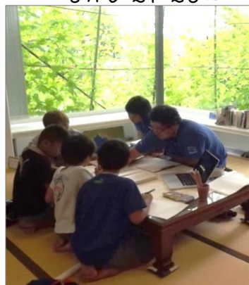
畳のコーナーで、ゆったりと。自由研究を相談中…。