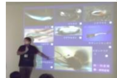
先生のはなしを聞いたり…

今年は講座と干潟体験の2つのコースで開催。23名の小学生と保護者の方が参加してくれました！