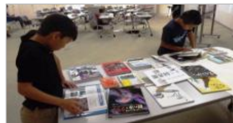
本にも色々なことが書いてあったね。