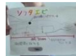
分かったことをミニポスターで発表したよ。