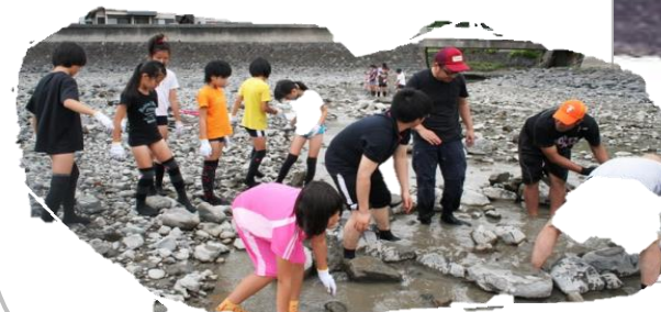
石を積んでウナギ塚にもチャレンジ！