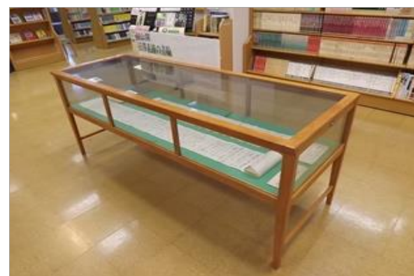
初公開の書簡(しょかん)の展示