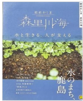
『肥前かしま 森里川海』 鹿島市