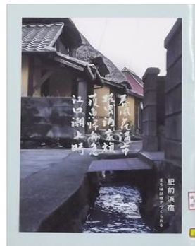
『肥前浜町 まちは記憶でつくられる』 肥前浜宿水とまちなみの会・鹿島市都市建設課