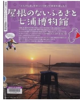
『屋根のないふるさと七浦博物館』 鹿島市