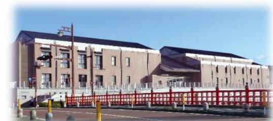
中川橋から見たエイブル

この25年間、図書館を作り上げてきたのは職員だけではありません。利用者の皆さま、市民の皆さまの力です。これまでの感謝を胸に、これからも、市民に愛され、市民と共に創る図書館であり続けてまいります。